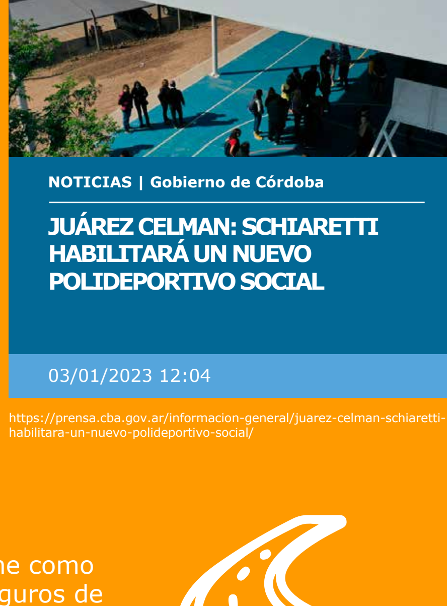
NOTICIAS | Gobierno de Córdoba JUÁREZ CELMAN: SCHIARETTI HABILITARÁ UN NUEVO POLIDEPORTIVO SOCIAL